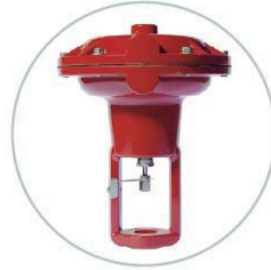
Standardantrieb ATC Standard actuator ATC