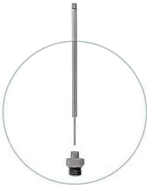
Standardinnengarnitur Standard innervalue