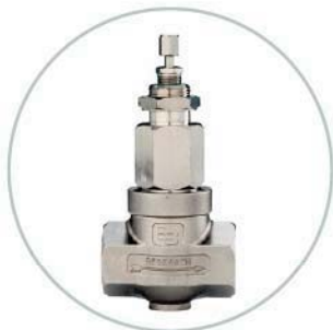
NPT-Standardgehäuse NPT standard housing