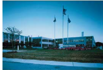
Badger Meter, Inc., Milwaukee, Wisconsin, USA