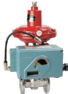
SRD 991 (Eckardt)