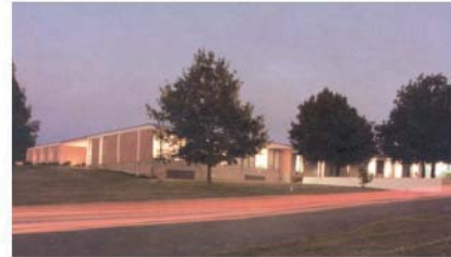
Badger Meter, Inc., Tulsa, Oklahoma, USA

Als 100%-iges Tochterunternehmen von Badger Meter Inc., USA mit Sitz in Milwaukee, Wisconsin, produziert und vertreibt Badger Meter Europa GmbH die Konzernprodukte weltweit, mit Ausnahme von USA, Kanada und Mexiko, die direkt von der Muttergesellschaft betreut werden. Mit ca. 1000 Mitarbeitern erwirtschaftet Badger Meter, Inc. einen Jahresumsatz von ca. 240 Millionen Euro.