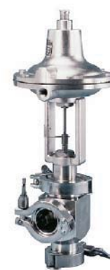
Laborbioventil Tri-Clamp® Anschluss

DN 1" – 1.5" Cvs 0.05 – 2.0 up to PN 20 -20 °C up to +150 °C