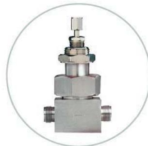
Hochdruckgehäuse High pressure housing