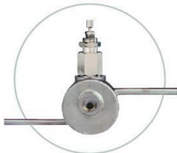
Heizmantelgehäuse Heating jacket housing