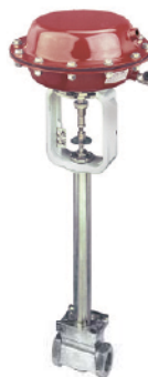
Tieftemperaturventil Zwischenflanschbauweise mit NPT Innengewinde

DN 1" – 2" kvs 0.02 – 25 up to PN 50 -70 °C up to +530 °C