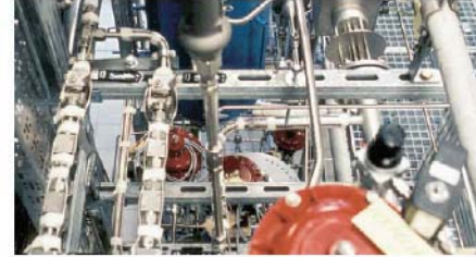
Technikumsanlage bei Uhde GmbH / Technology plant at Uhde GmbH, Germany.

Von der Planung... bis zur Realisierung Planning... up to realization