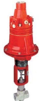
BLRA/TLDA (Badger Meter)