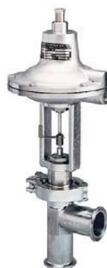
Gussbioventil Tri-Clamp® Anschluss

The SC 500 series has been designed to meet the demand of hygienic, pharmaceutical or food applications. Valves with flanges or special pipe connections, extended bonnets for hot or cold fluids, and 3-way valves. All designs can be provided with pneumatic actuators and a wide variety of accessories.