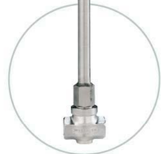
Tieftemperaturverlängerung Cold temperature extension

Detaillierte Datenblätter finden Sie unter www.badgermeter.de/pdf.Daten Detailed technical bulletins can be downloaded under www.badgermeter.de/pdf.files