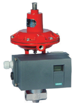
SIPART PS 2 (Siemens)