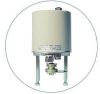
Elektrischer Antrieb HH 500 Electrical actuator HH 500