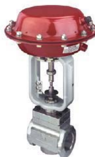
Standardventil Zwischenflanschbauweise mit NPT Innengewinde

The rugged, corrosion-resistant construction offers features and performance normally found in more expensive designs. The compact, high performance, all-steel actuator, along with standard body assembly construction of stainless steel, is designed to provide years of service and simple easy maintenance. A few more standard features include: adjustable spring preload, adjustable travel stop, heavy body cross section and replaceable seals on all reduced innervalves.