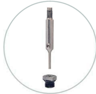
Innengarnitur für Kälteventile oder Ventile mit Balgdichtung Innervalue for cryogenic valves or valves with bellows seal