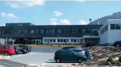
Badger Meter Europa GmbH in Neuffen, Deutschland/Germany