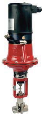
8048 digital (Schubert & Salzer)