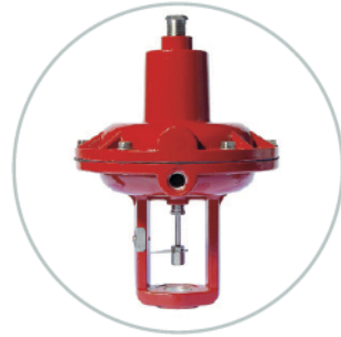
Standardantrieb ATO Standard actuator ATO