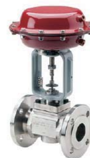
Geflanshtes Ventil Einschweißflansche

DN 1" – 2" Cvs 0.02 – 25 up to PN 50 -70 °C up to +530 °C