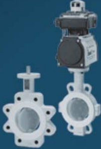
LINED BUTTERFLY VALVES