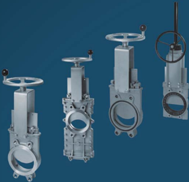
KNIFE GATE VALVES