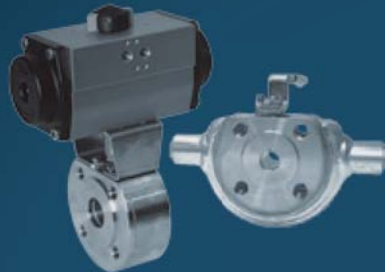
BALL VALVES WAFER TYPE BALL VALVES WITH HEATING JACKET