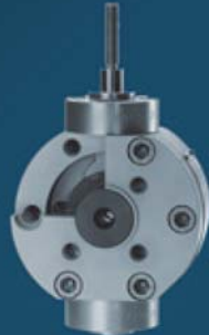
CERAMIC SLIDE DISC VALVES