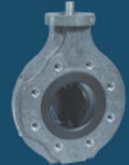
PTFE/PFA LINED BUTTERFLY VALVES THERMOSETTING PLASTIC BODY