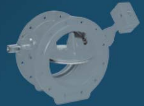
TILTING DISC CHECK VALVES