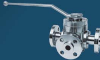
MULTI-WAY BALL VALVES FOR DEMANDING APPLICATIONS