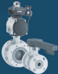
LINED BALL VALVES