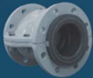
aiRFlex® PINCH VALVES