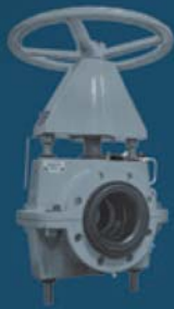
MANUAL PINCH VALVES