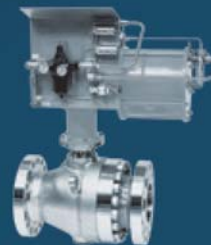
2-WAY BALL VALVES