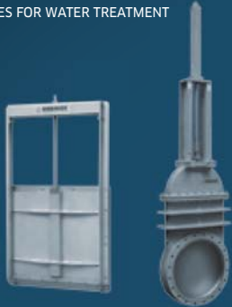
VALVES FOR WATER TREATMENT