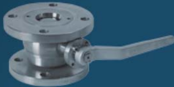
FULLY WELDED BALL VALVES