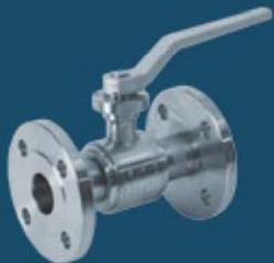
BALL VALVES WAFER TYPE BALL VALVES WITH HEATING JACKET