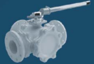
3/4-WAY BALL VALVES DIN/ASME