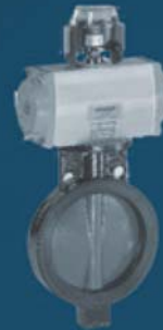
QUICK SHUT-OFF BUTTERFLY VALVES