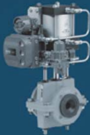
PNEUMATIC PINCH VALVES