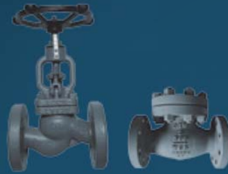
GLOBE AND CHECK VALVES