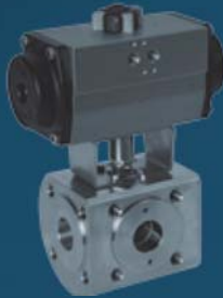
3/4-WAY BALL VALVES