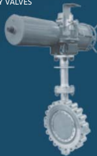
TRIPLE ECCENTRIC BUTTERFLY VALVES