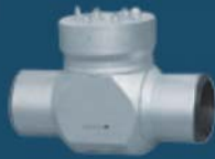
SWING CHECK VALVES