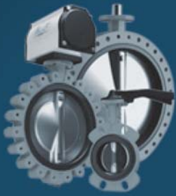
SOFT SEATED BUTTERFLY VALVES