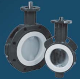
PTFE/PFA LINED BUTTERFLY VALVES