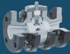
CERAMIC BALL VALVES